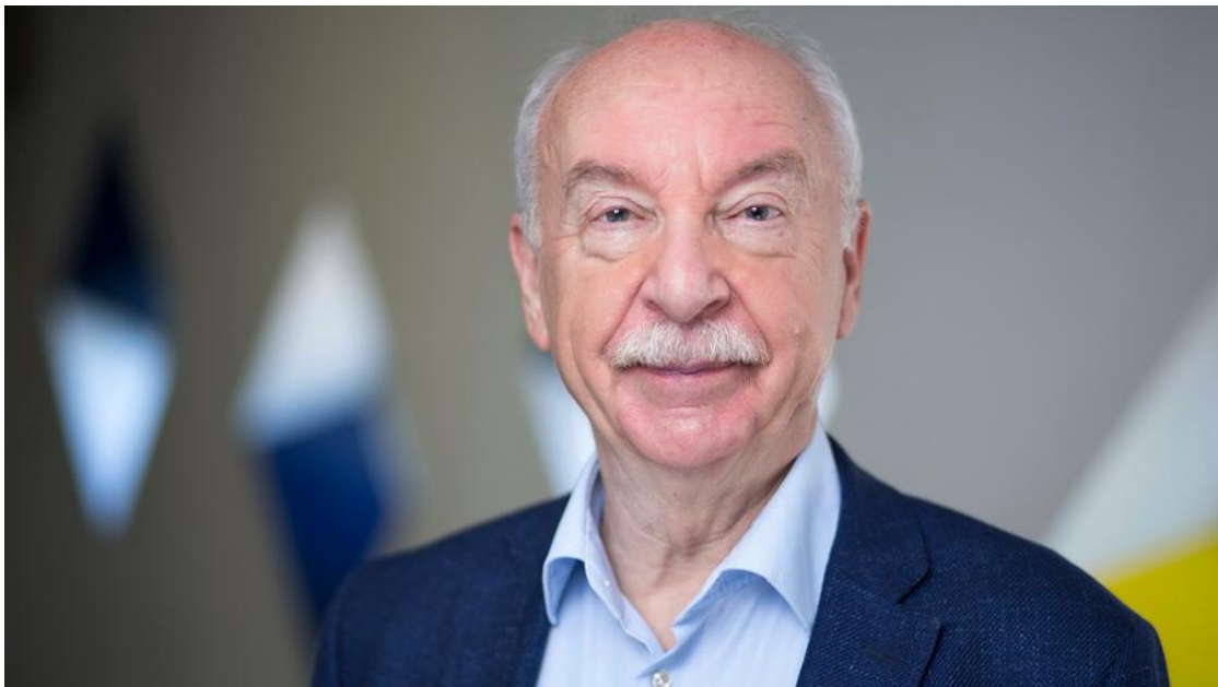
Risikoforscher Gerd Gigerenzer

Gerd Gigerenzer vom Max-Planck-Institut für Bildungsforschung warnt vor Panikmache: „Aus Angst getriebene Menschen bringen sich oft zusätzlich in Gefahr“